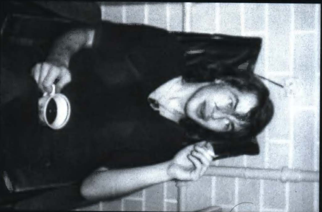
27. В Новосибирске (декабрь 1985)