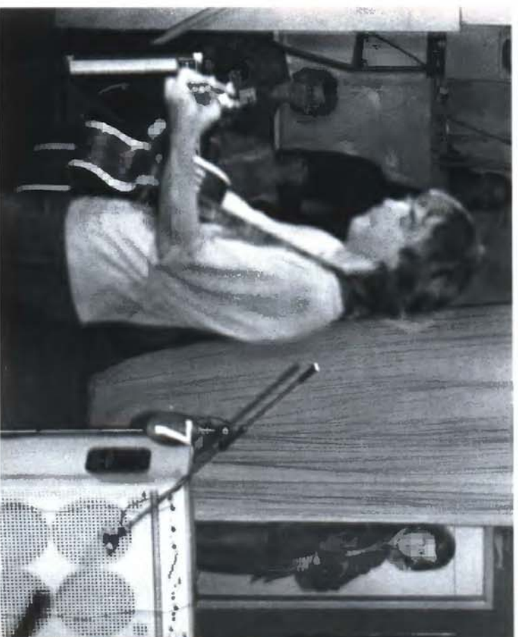
35. На пятом фестивале Ленинградского Рок-клуба. Из-за кулис смотрит Борис Гребенщиков (7 июня 1987)