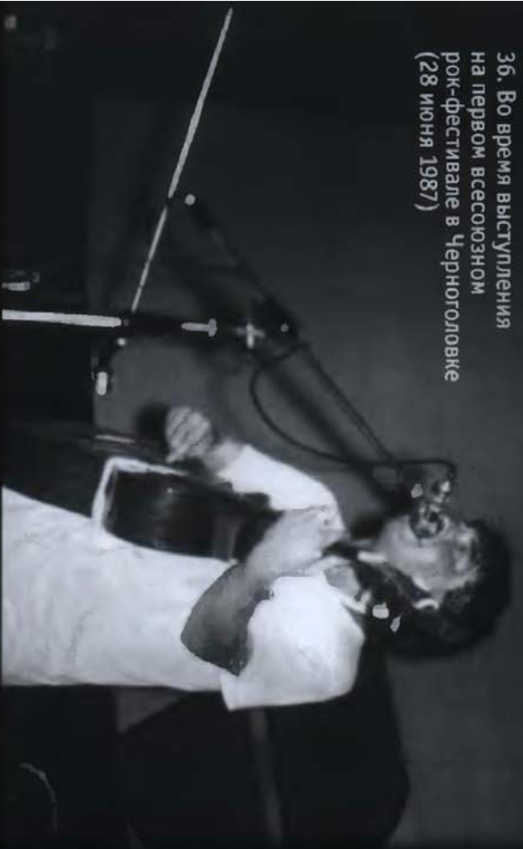
36. Во время выступления на первом всесоюзном рок-фестивале в Черногловке (28 июня 1987)