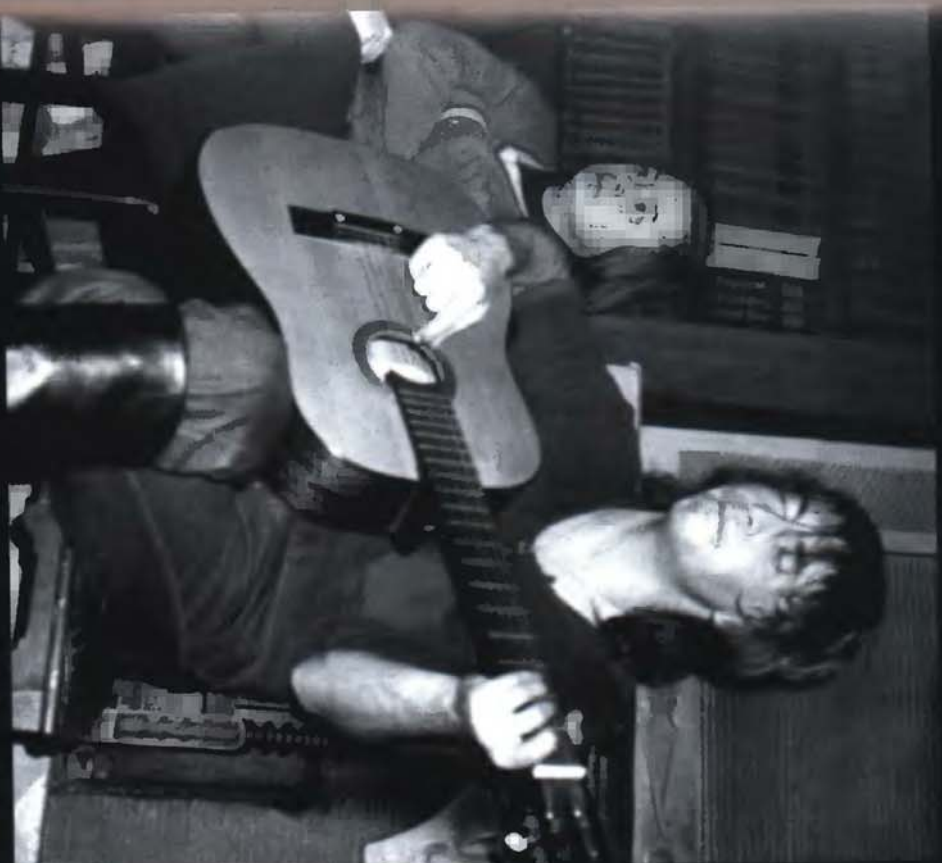
26. На квартирном концерте в Ленинграде на Петроградской стороне (7 ноября 1985)