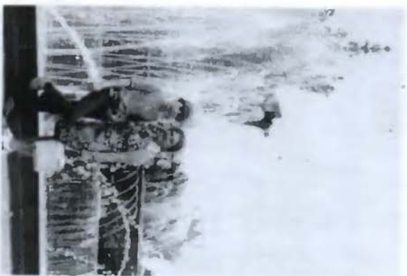
6. С мамой в районе ВДНХ в Москве (август 1974)