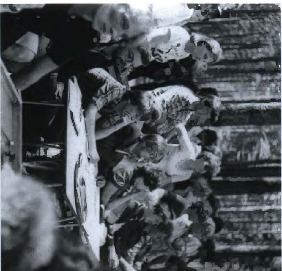
18. С Леонидом Парфёновым в жюри фестиваля политической песни и современной музыки «Ритмы молодости в борьбе за мир» (2 июня 1984)