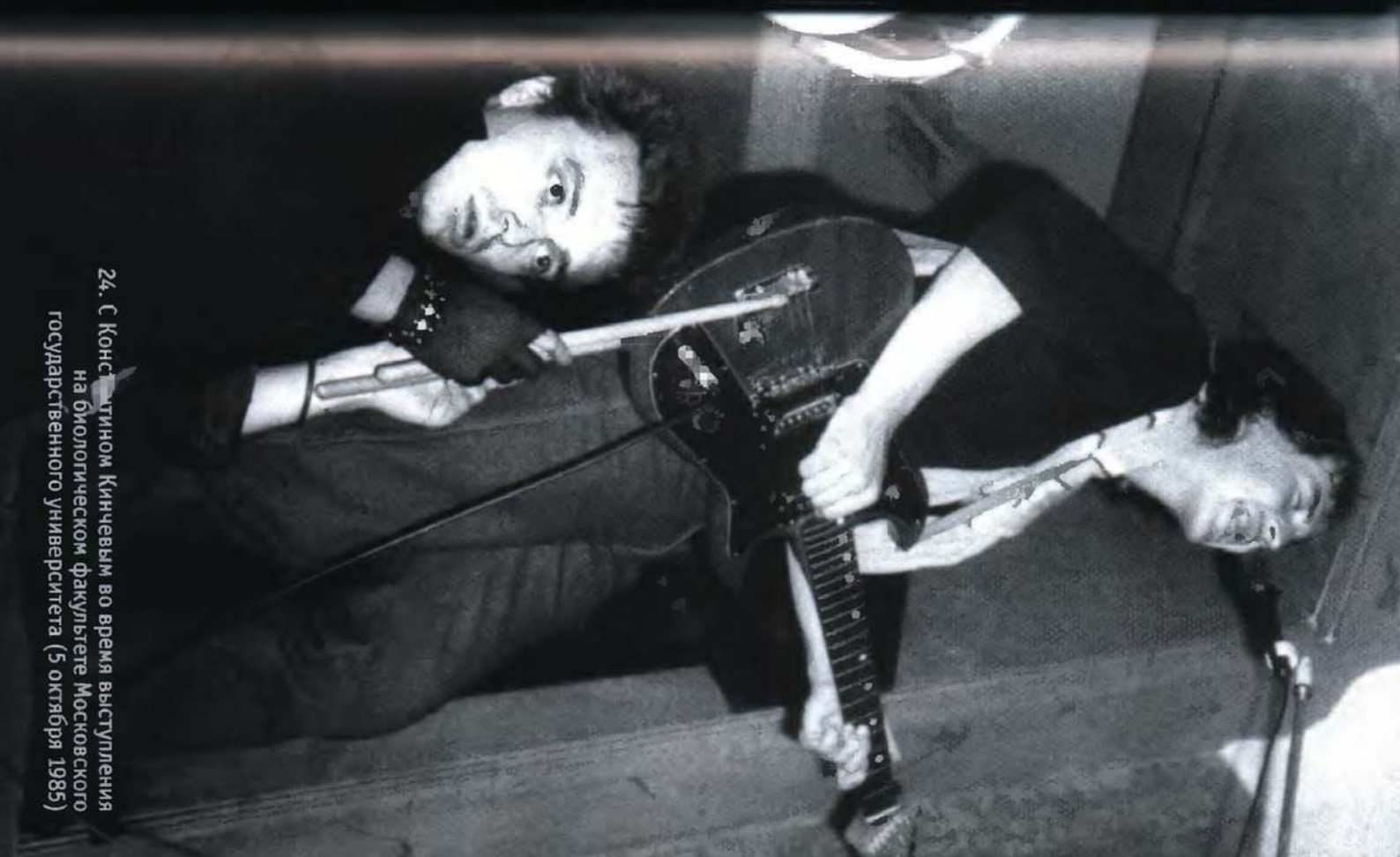
24. С Константином Кинчевым во время выступления на биологическом факультете Московского государственного университета (5 октября 1985)