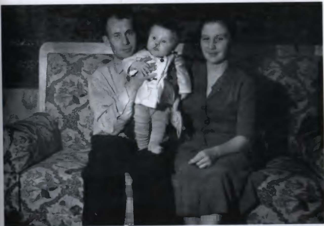
1. С папой и мамой (1960)