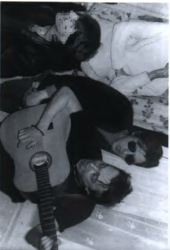
29. На концерте в Бусиновом после дня рождения Анжели Каменцевой. Слева направо: Александр Башлачёв, Михаил «Майк» Науменко, Константин Кинчев (8 января 1986)