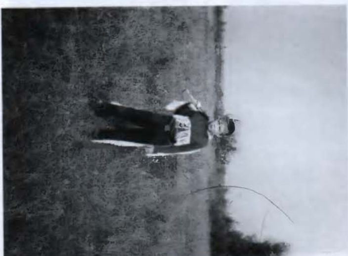
5. Играет в индейцев (1973)