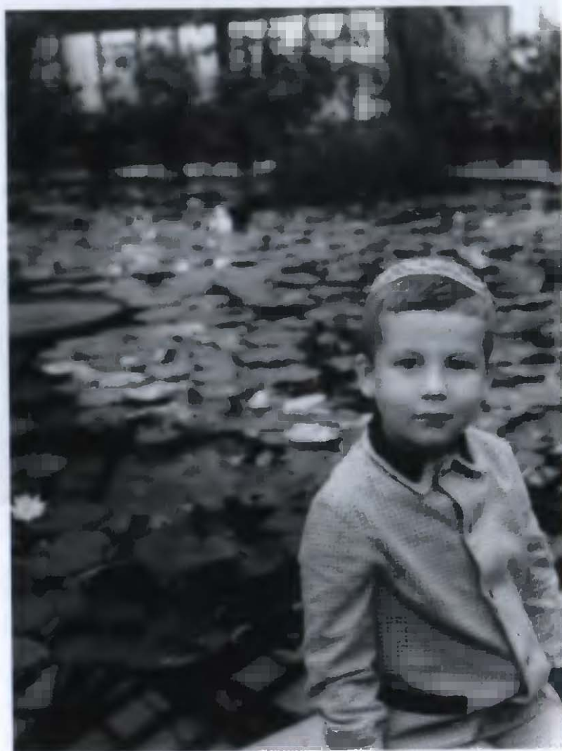
2. В ленинградском Ботаническом саду (июнь-июль 1967)