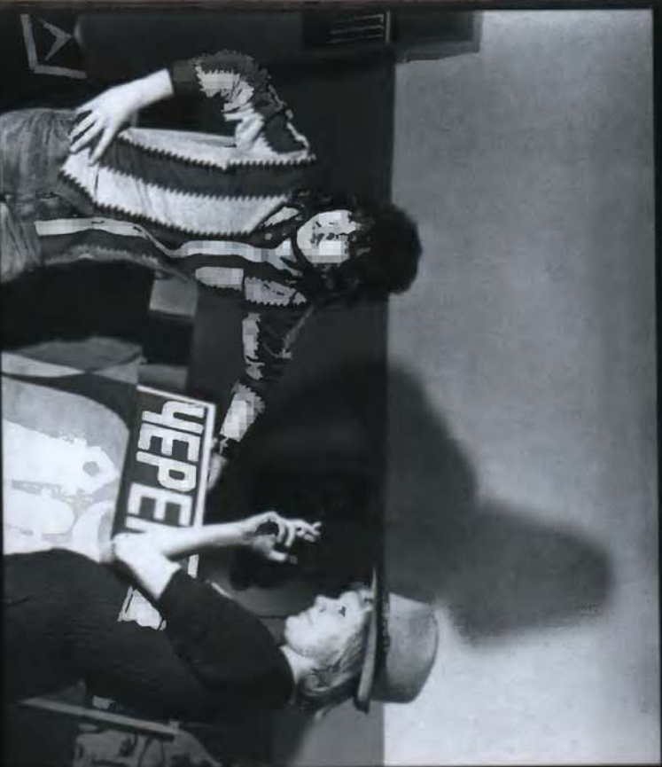
12. На Череповецком металлургическом заводе в должности художника (1977)