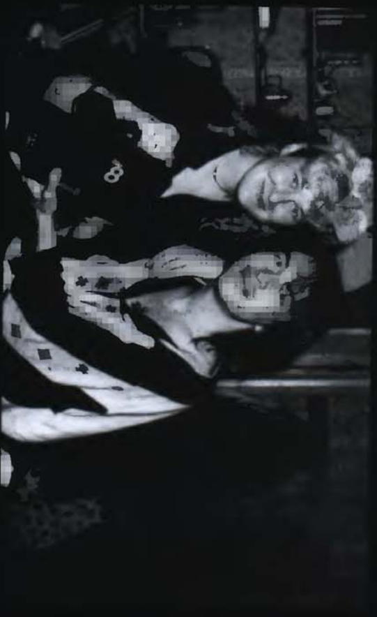
32. С Джоанной Стингрей (май 1986)