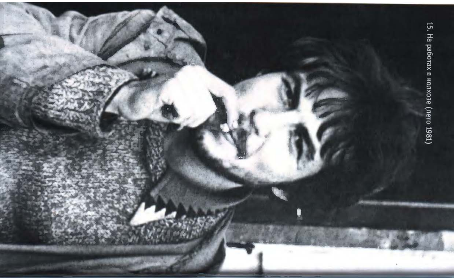
15. На работах в колхозе (лето 1981)